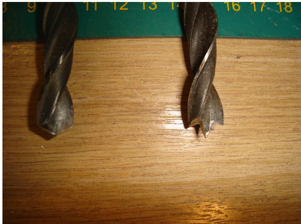
Links metaalboor (fout) rechts houtboor (goed) .

Beter is het van twee kanten te boren met een houtboor (11 mm) Vorboren met 3 of 4 mm. Dan ontstaat er eerst een ring door de boor randjes , daarna wordt het gat verder uitgeboord.